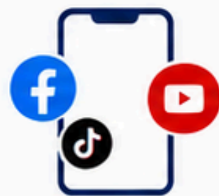
Mạng xã hội